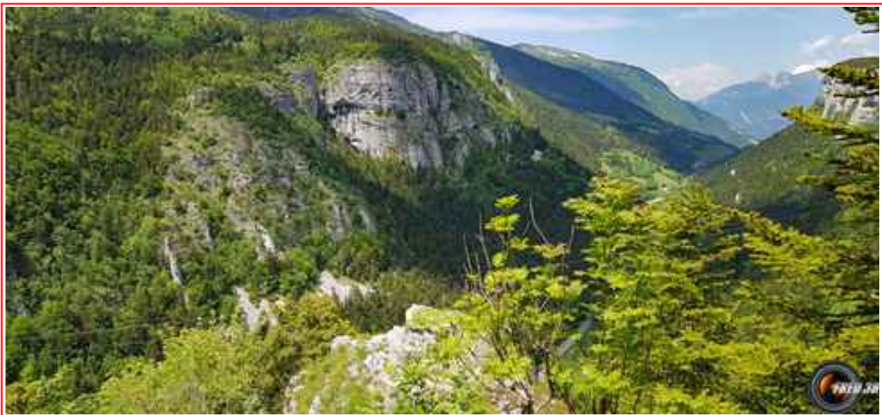
Le belvédère du Bec de l'Aigle.

Itinéraire 7 km (boucle), 400 m de dénivelé.