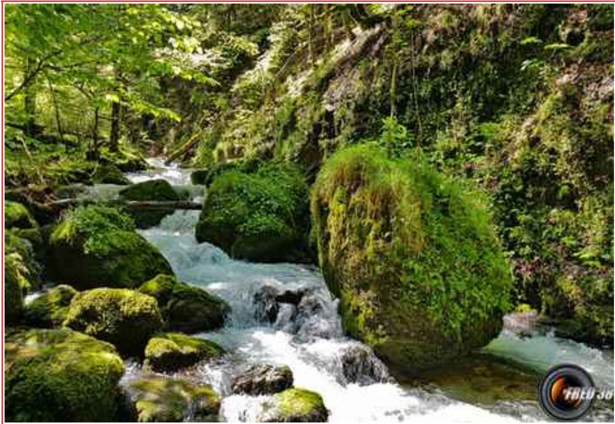
Le torrent du Bruyant.