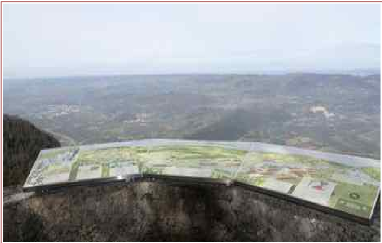
Belvédère du Rivet