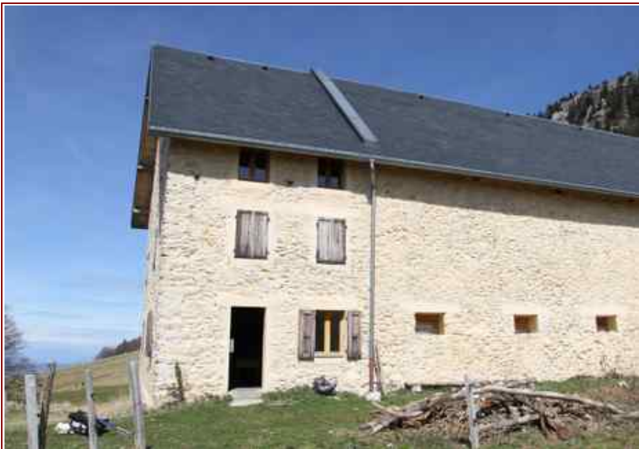
Ferme de la Fessole