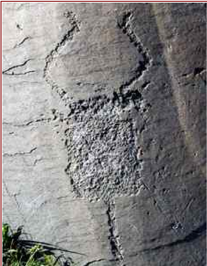
L'une des gravures rupestres du site de Fontanalba.

Itinéraire pour le lac le plus haut 6,5 km, 660 m de dénivelé positif.