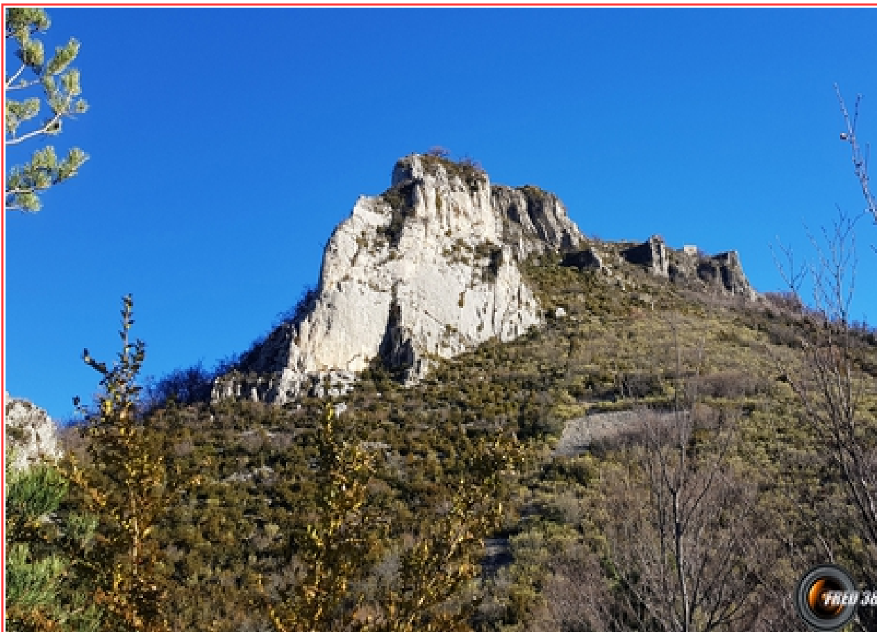
Vue du col sans nom.

MASSIF : Diois Baronnies CARTE : IGN 3240 OT