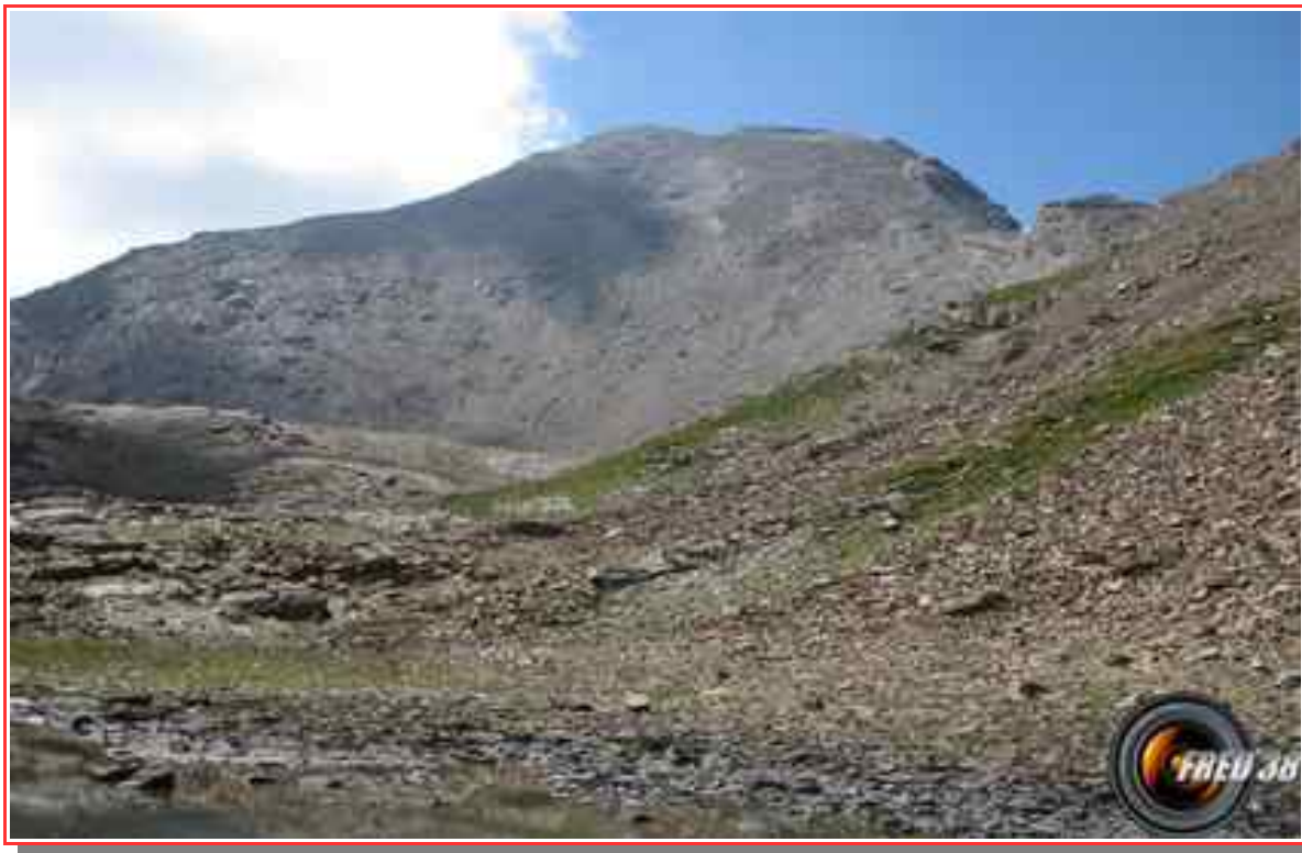
Le sommet vu du petit lac Etoilé