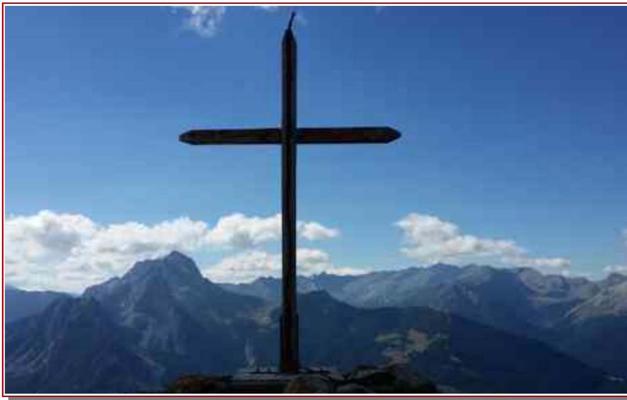
La croix du sommet et à gauche la Grande Séolane.