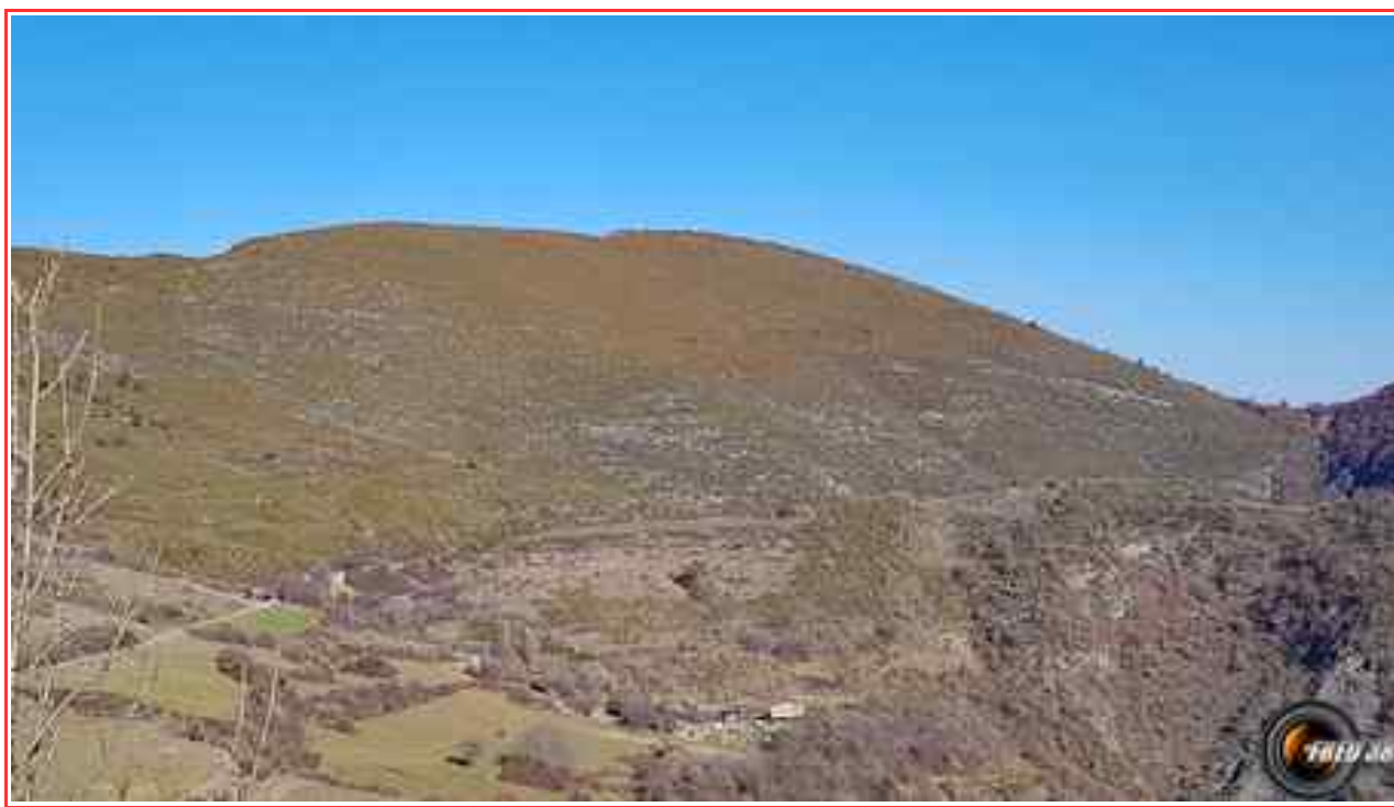
Le sommet vu d'Entrages.