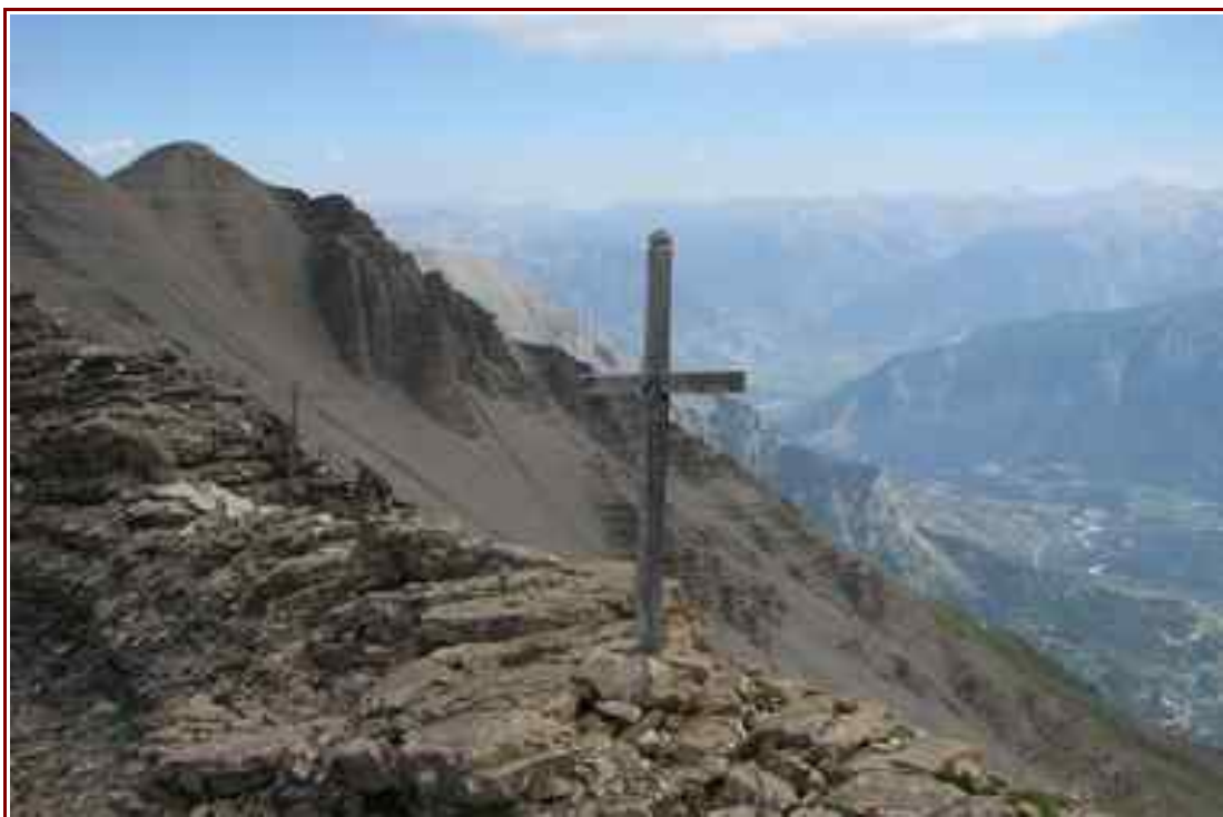
L'une des Croix sur la crête