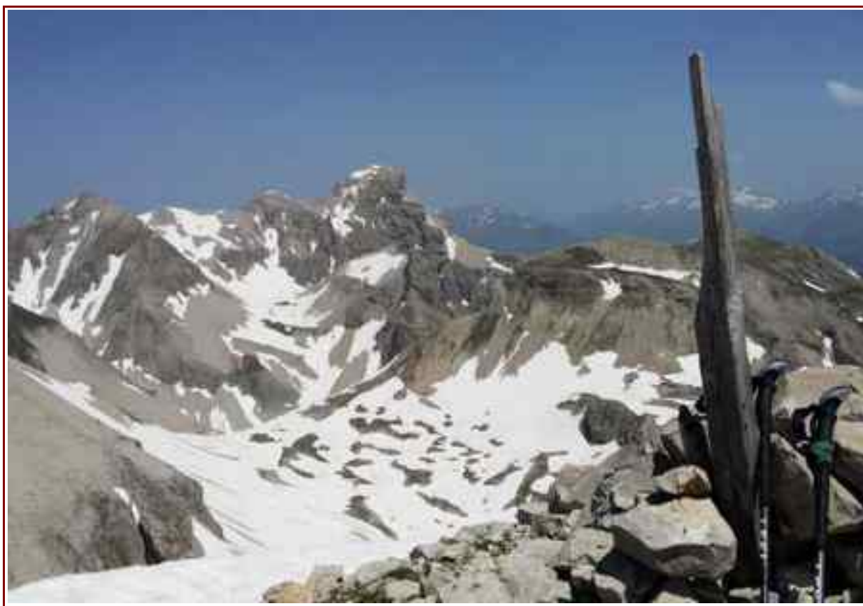
L'Obiou vu du sommet

Denivelé : 1400 m, Longueur : 12 km (a/r)