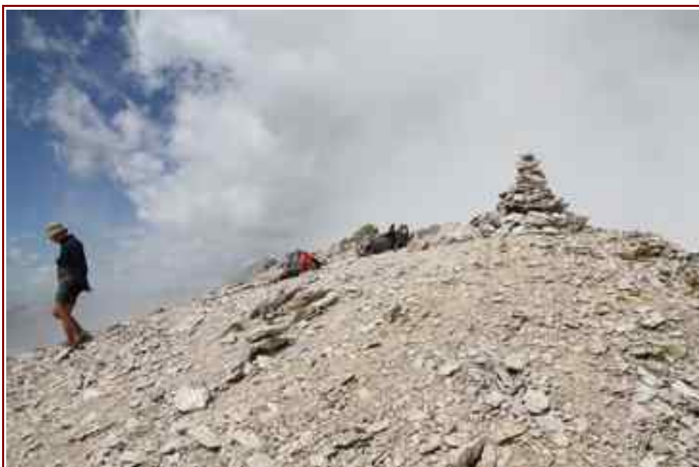
Photo du haut, la Statue de la Sainte Vierge juste avant le sommet, et ci-contre le cairn du sommet.