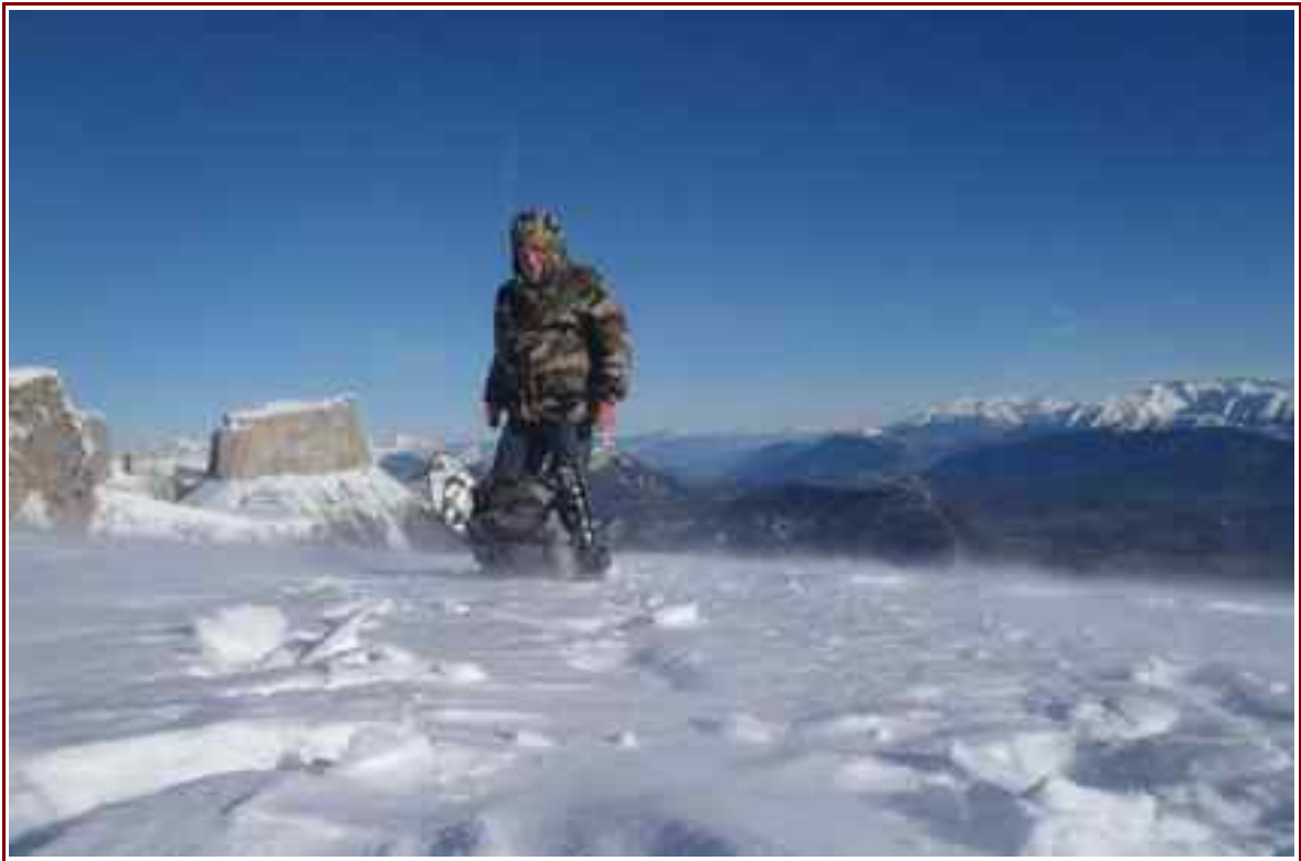
Photo du sommet

Itinéraire pour le sommet 5,8 km, 561 m de dénivelé positif.