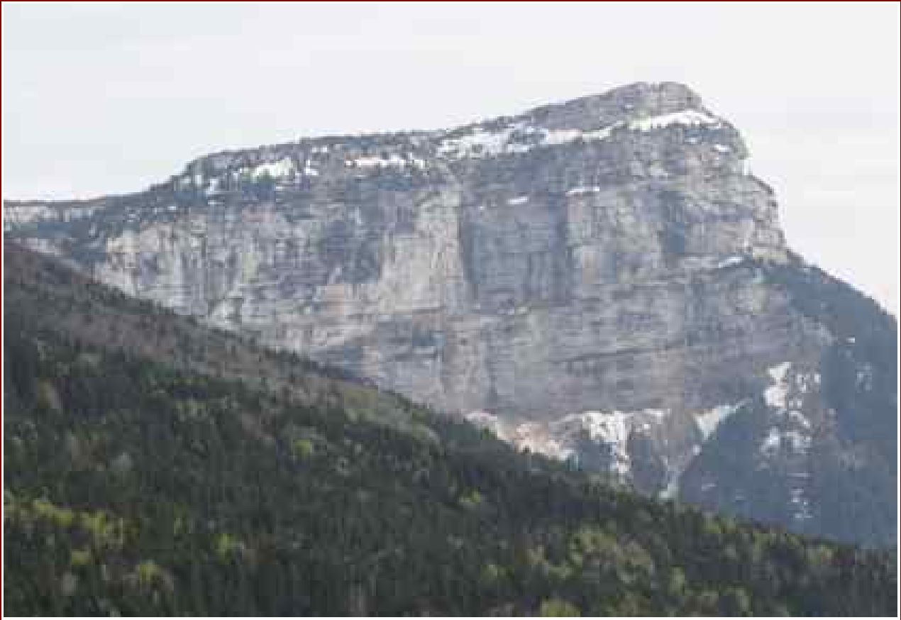
Le sommet vu du Granier