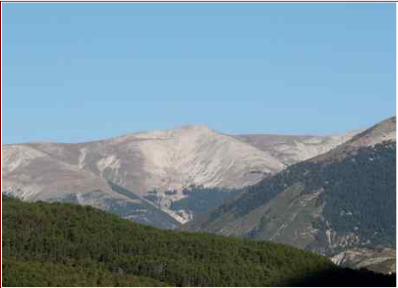
Le sommet vu de la Colle St Michel