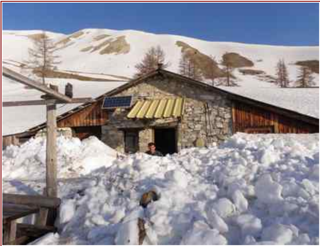
Cabane du Cheval Blanc

Itinéraire pour le sommet 6 km, 1235m de dénivelé positif.