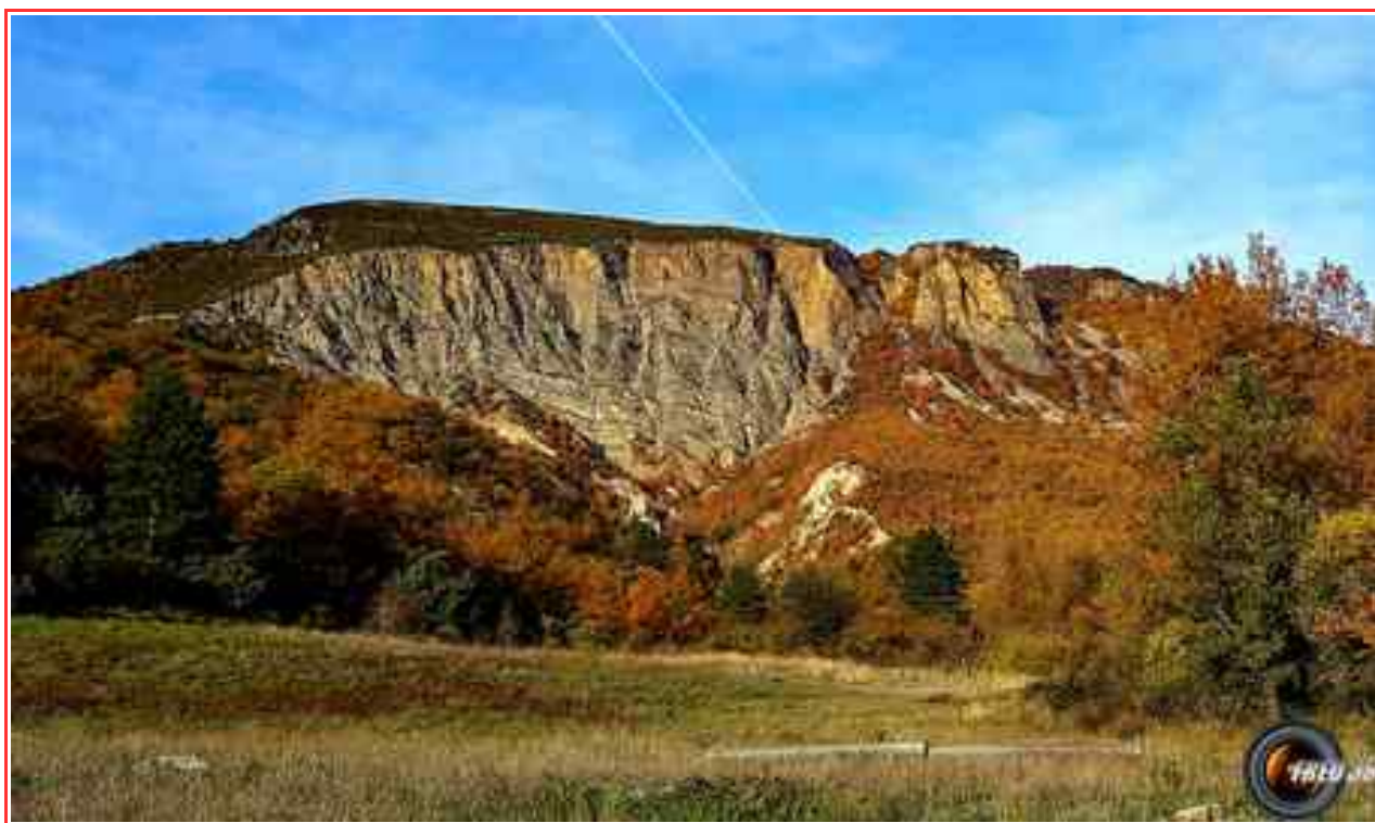
Le sommet vu de la montée.

MASSIF : Pré-Alpes de Haute-Provence CARTE : IGN 3442 OT