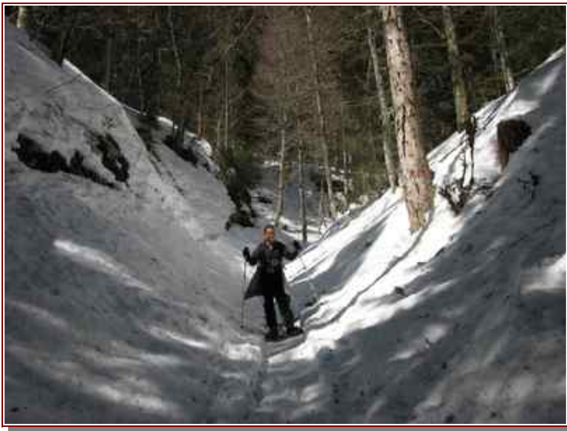
Le début du vallon de Naves

Itinéraire pour le Signal 10,6 km, 561 m de dénivelé positif.