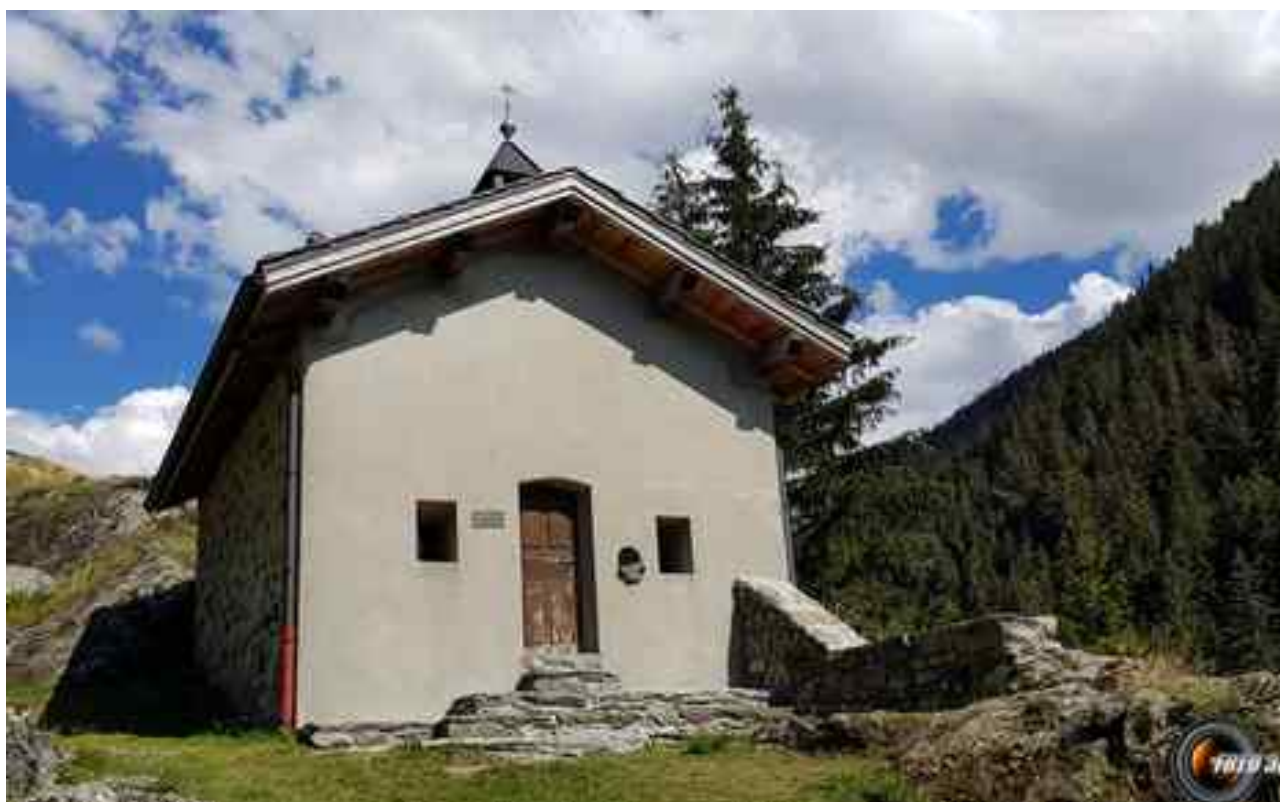
Chapelle des Gorges.

— Itinéraire 6 km, 375 m de dénivelé positif.