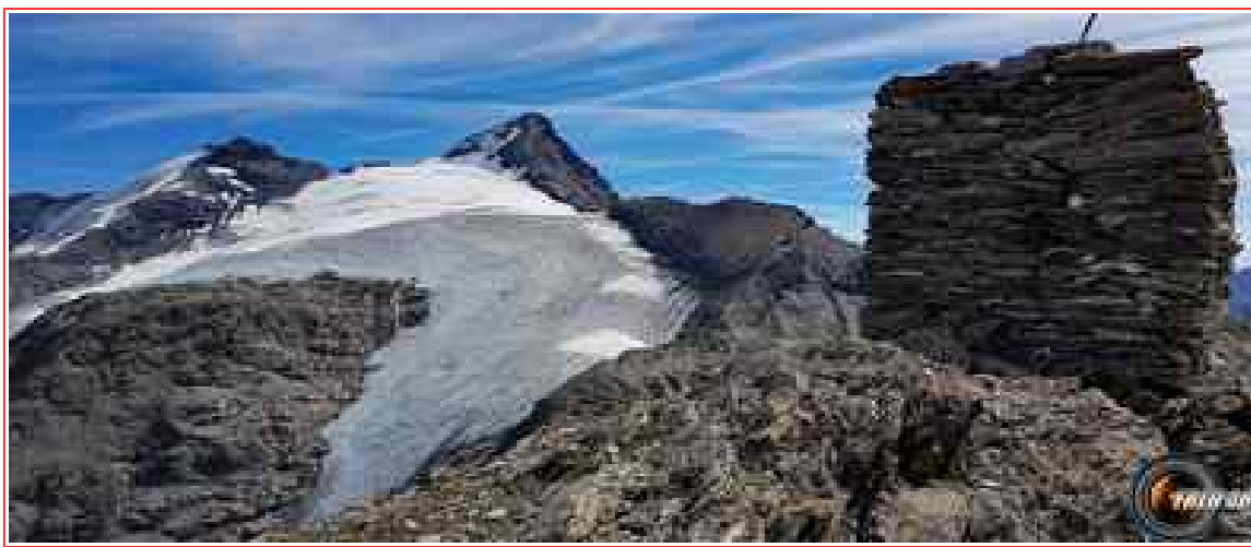
Le cairn du sommet.

Itinéraire pour le sommet 9 km, 900 m de dénivelé positif.