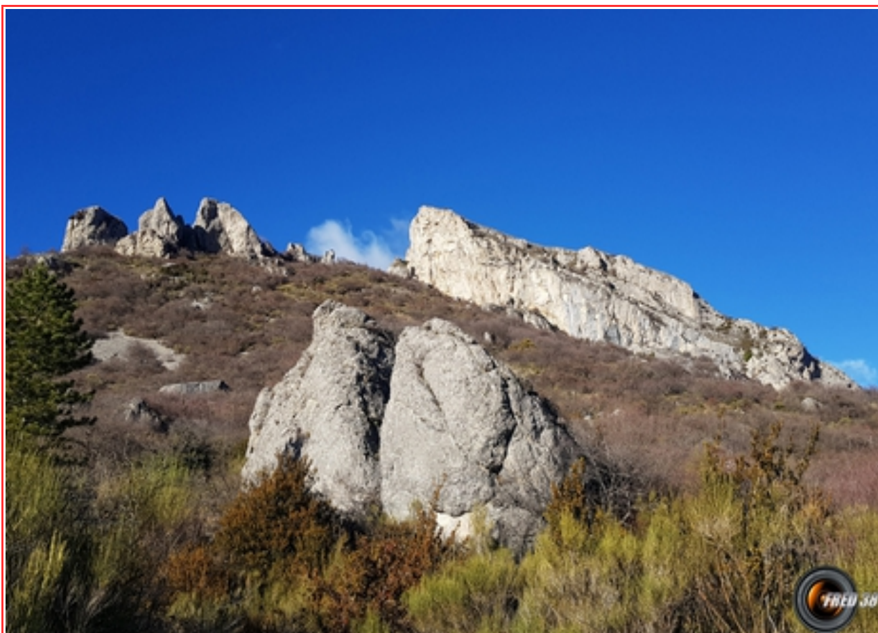
Vue versant ouest.