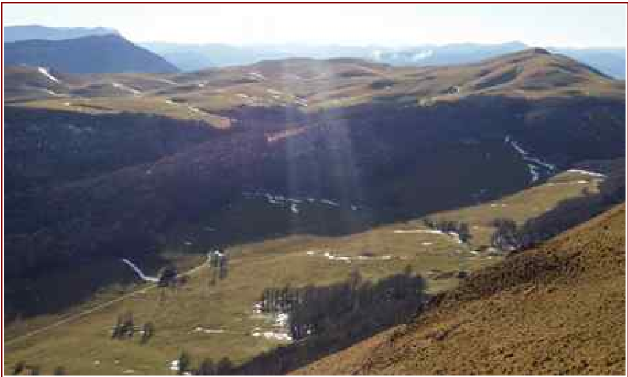
Le plateau d'Ambel vu du sommet