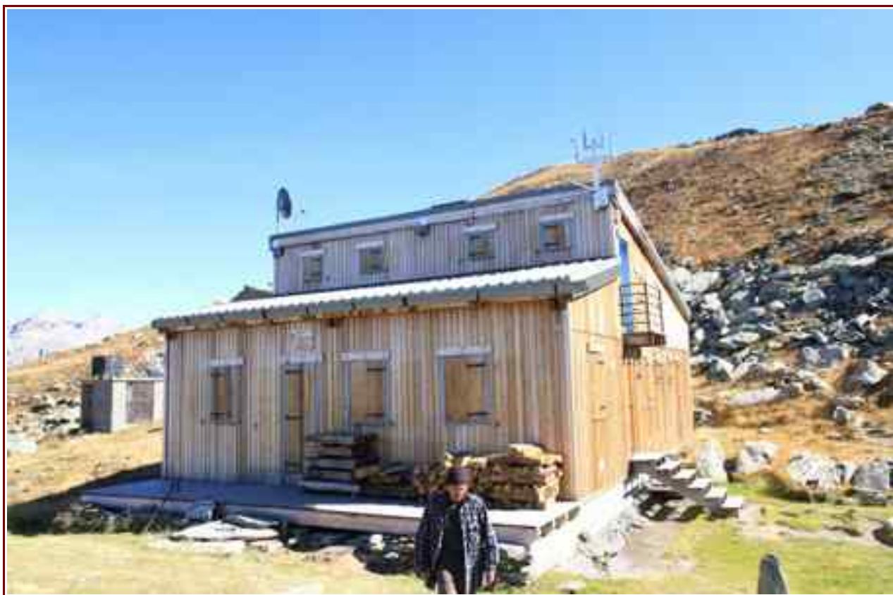
Le refuge avec sa petite terrasse