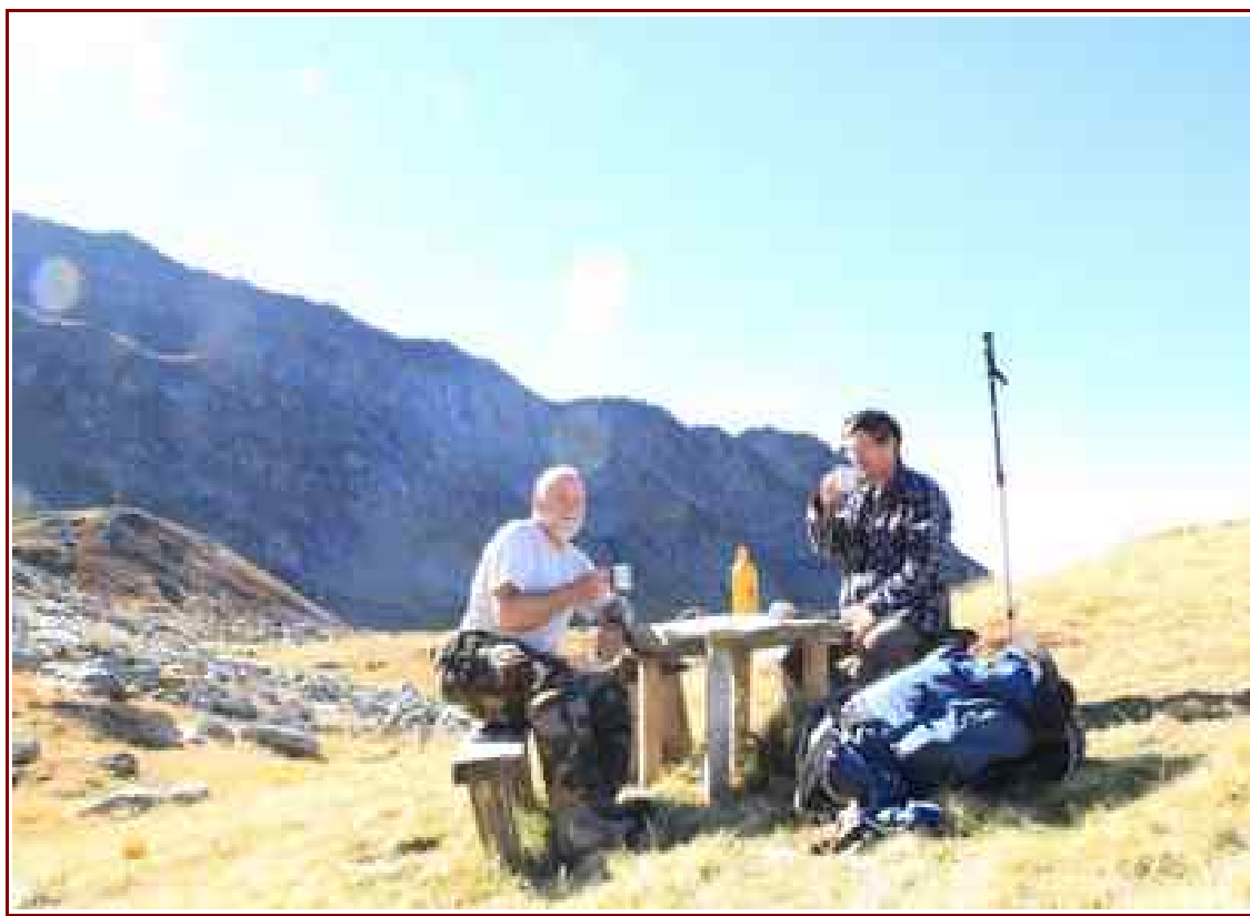
« Terrasse » devant le refuge