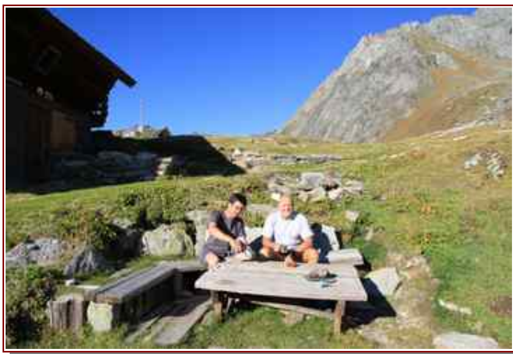
Pause au refuge