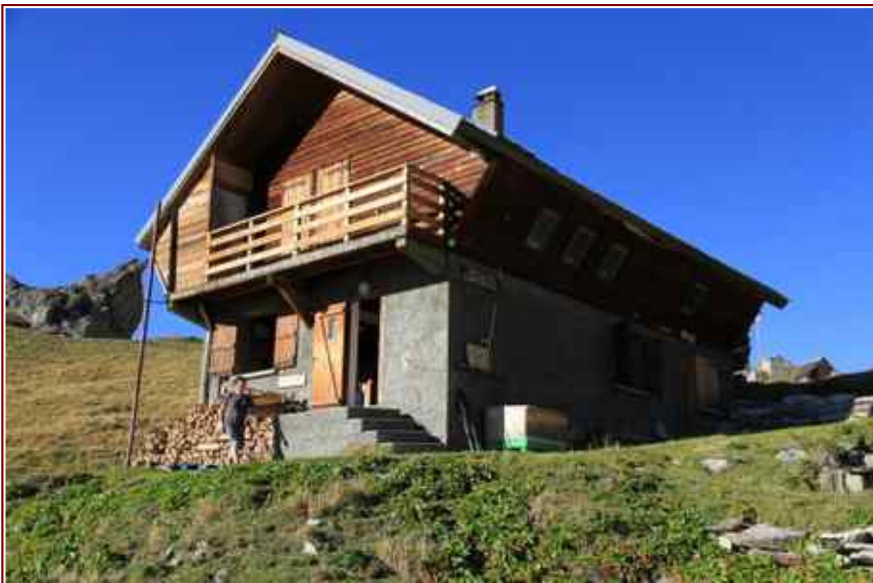
Le refuge sous la pointe de la Vuzelle