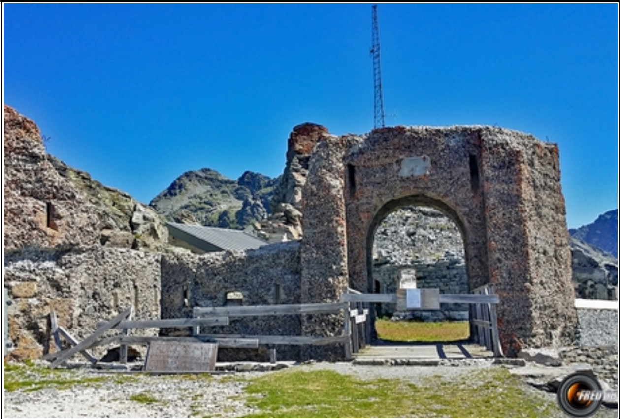
L'entrée de la Redoute.

MASSIF : Beaufortain CARTE : IGN 3531 ET