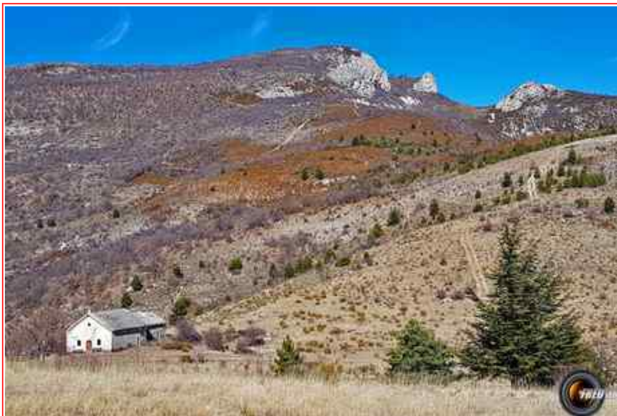
La chapelle Saint-Claude et le sommet.

MASSIF : Diois/Baronnies CARTE : IGN 3339 OT