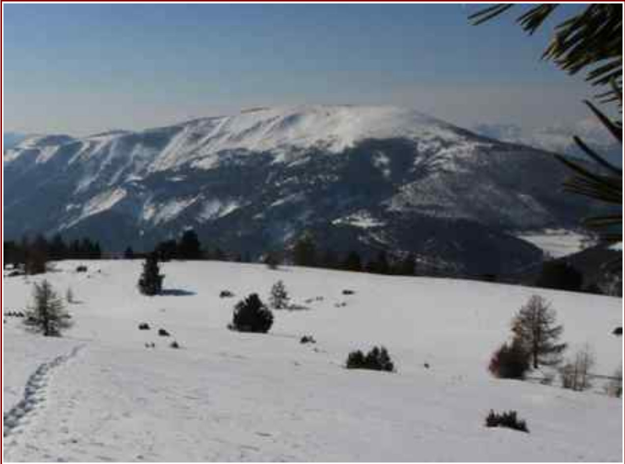
Sommet vu du Couradour