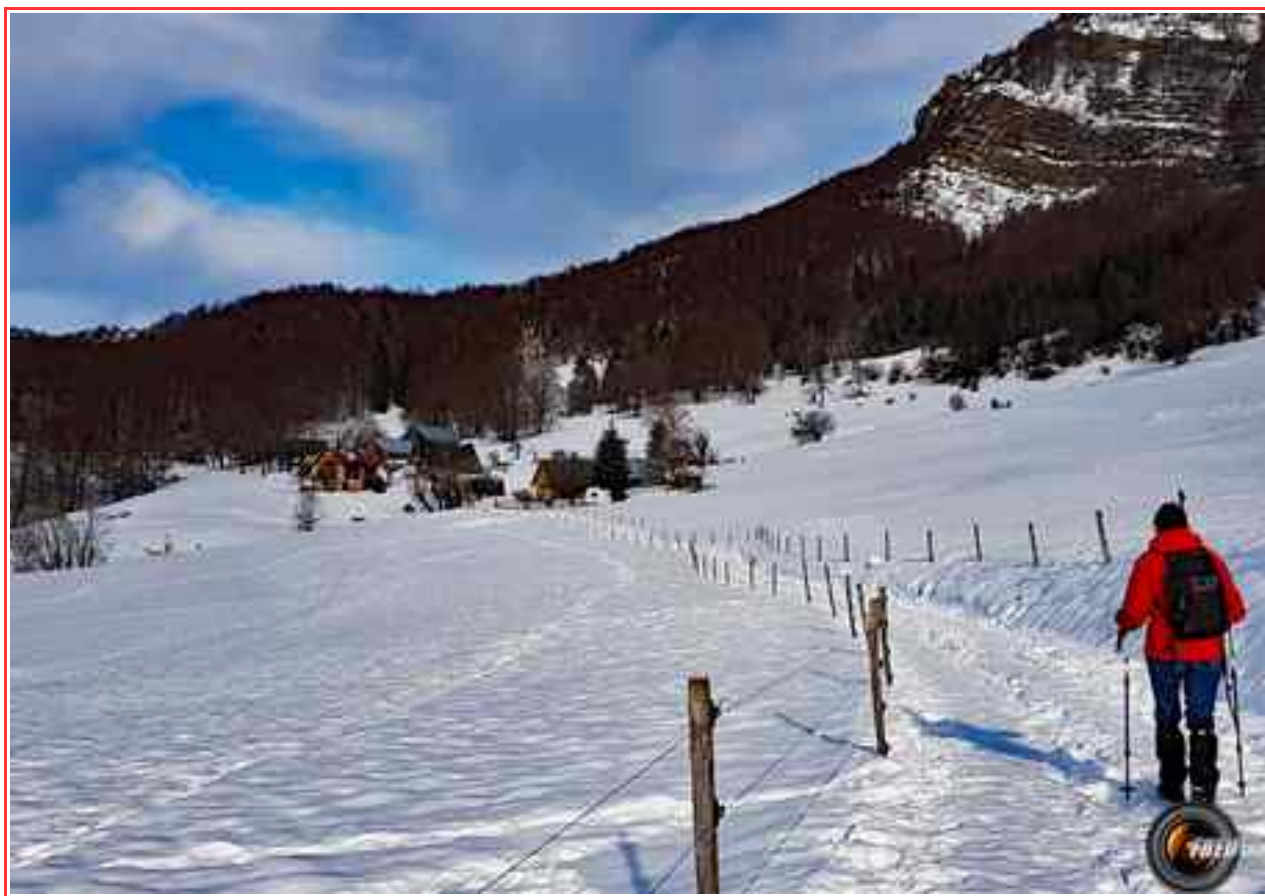
Les Granges de Joigny.