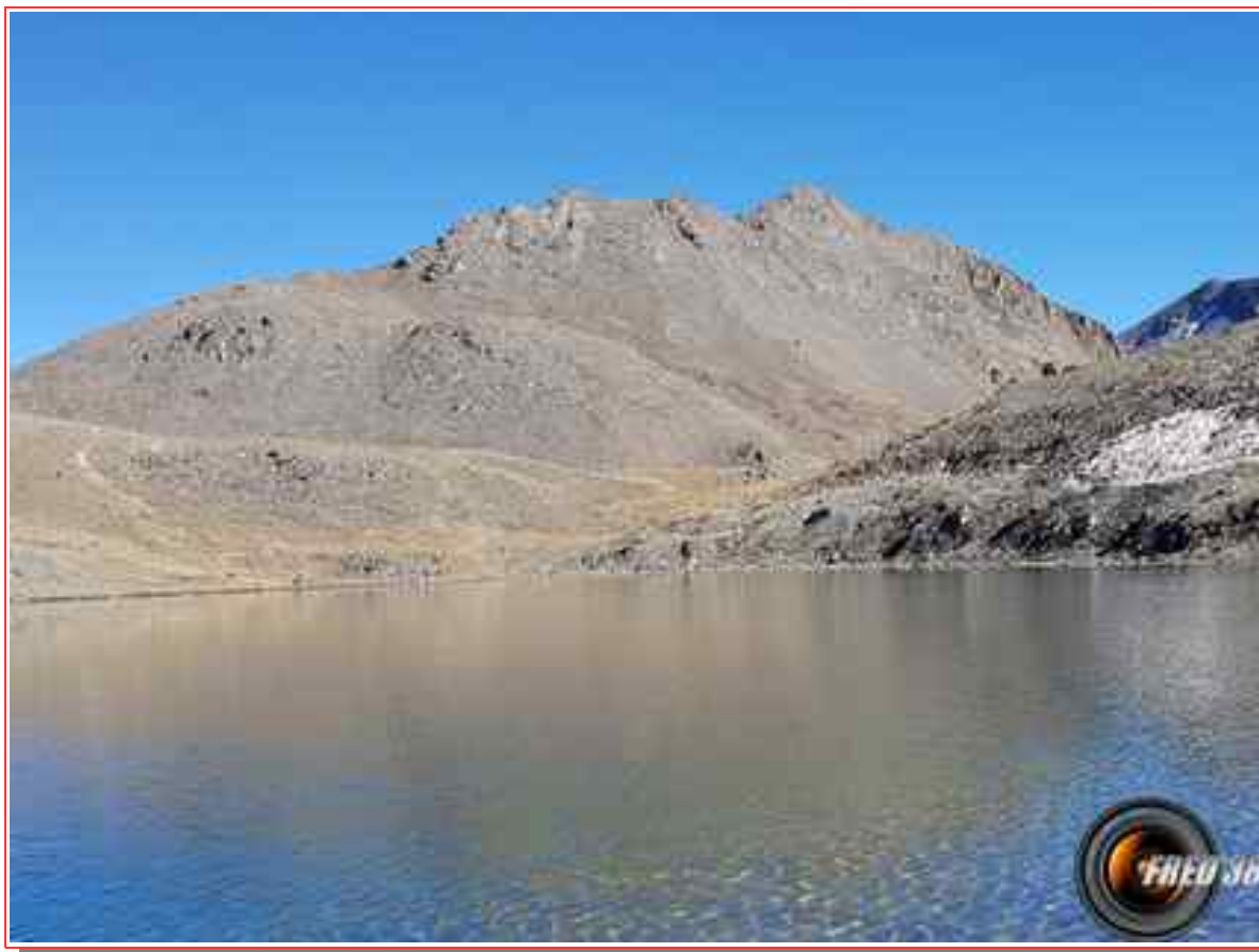
Le sommet vu du lac de la Rocheure.