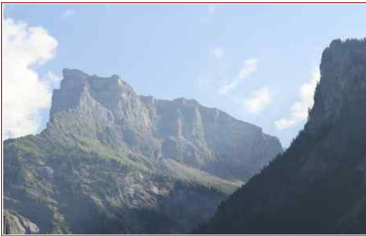
La pointe vue de Salvagny