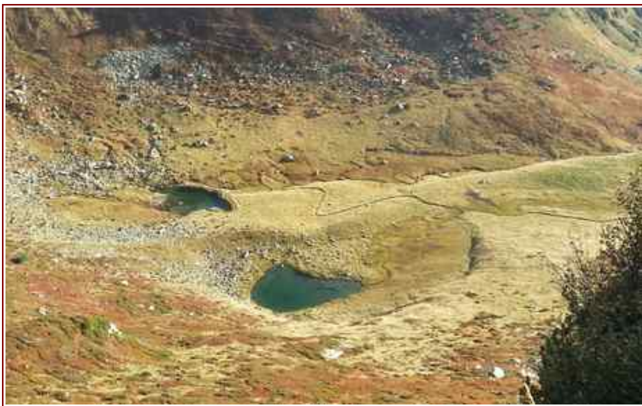
Les lacs du Loup vu du col éponyme