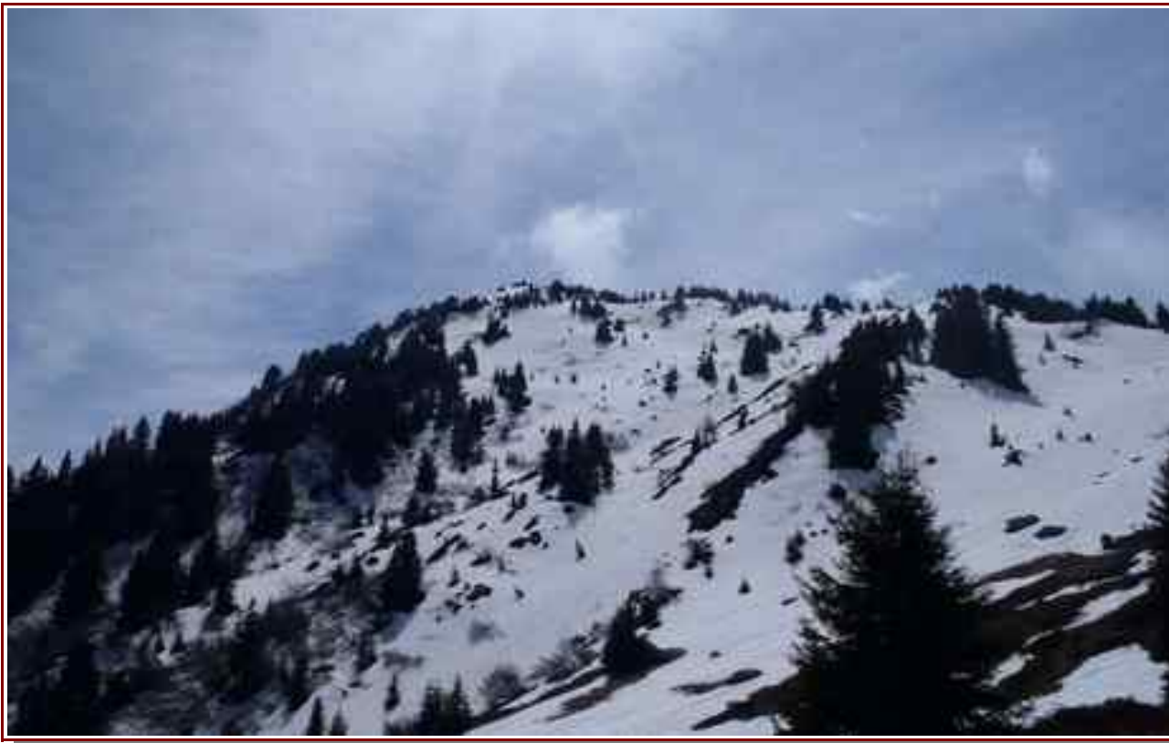
Le sommet vu d'au dessus du chalet d'en Haut