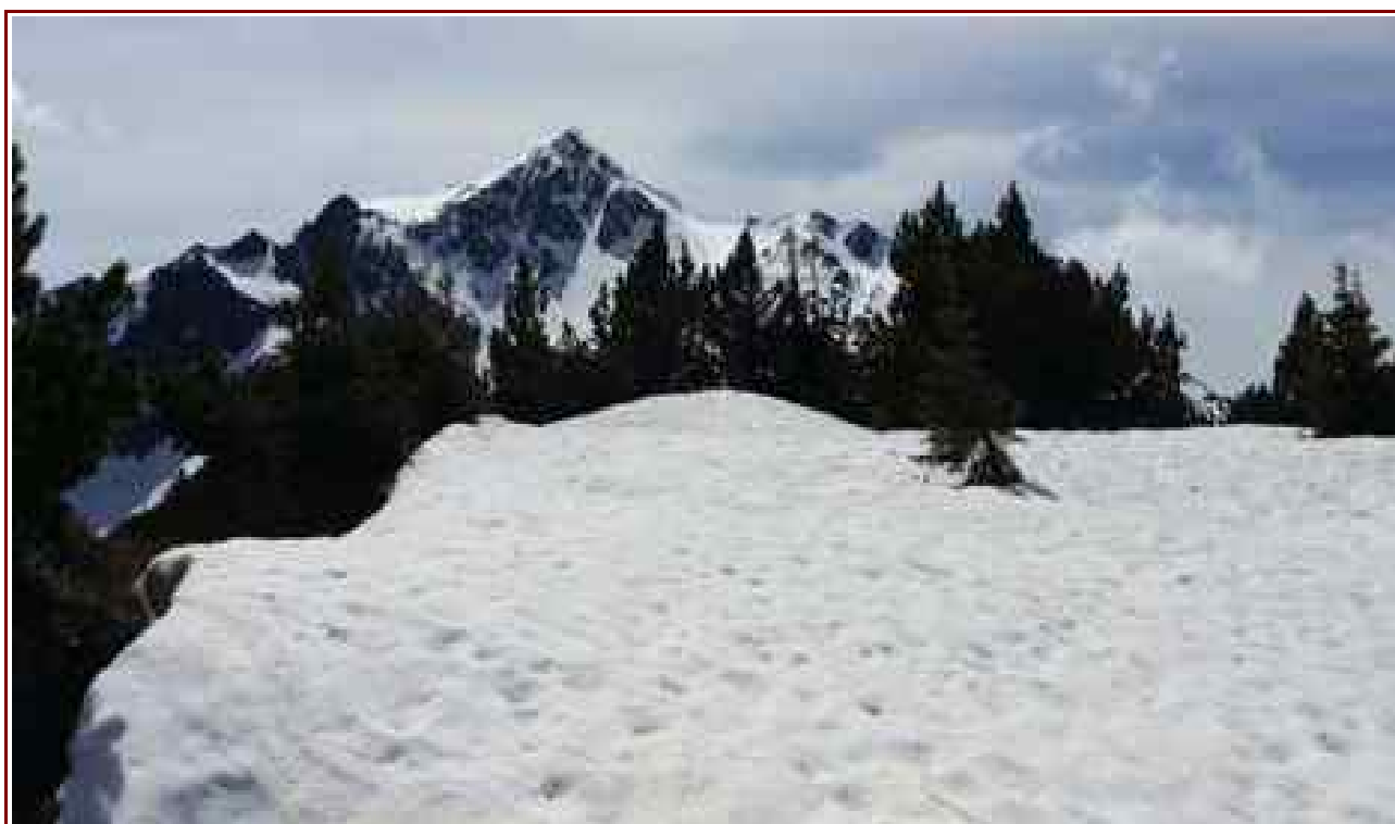
Le Bellacha vu du sommet