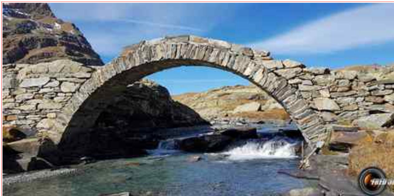
Le « Pont Romain ».