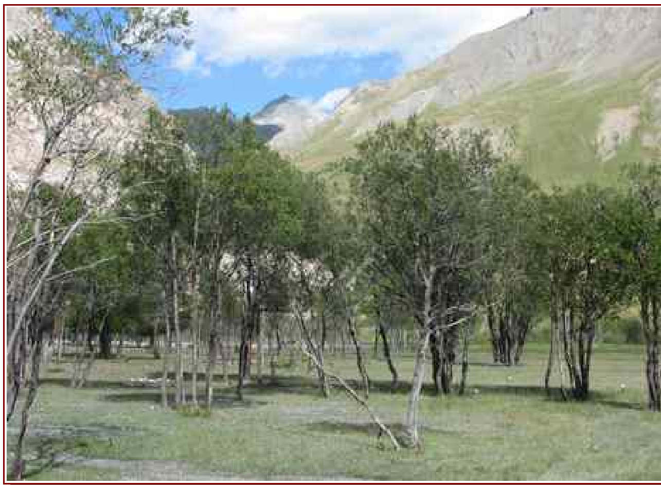
Dans le bois de feuillus