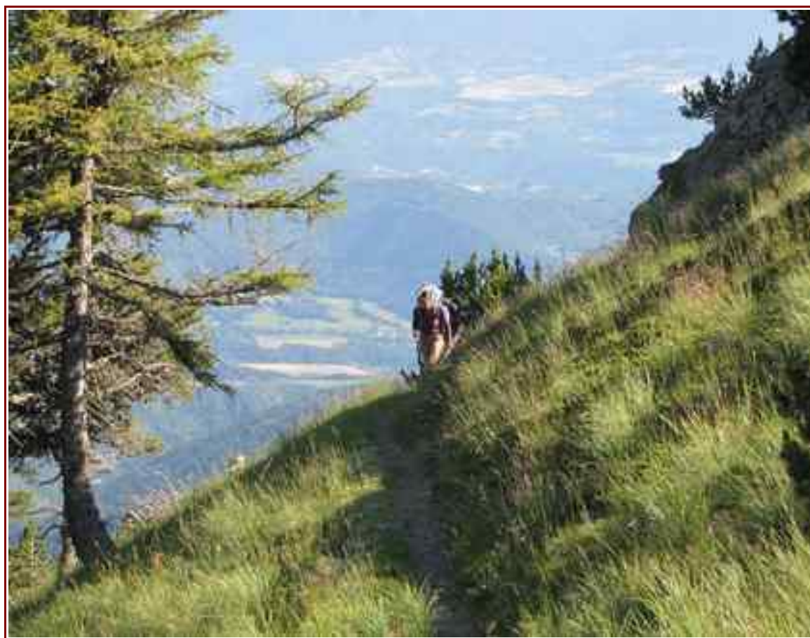
Sortie de la partie boisée avant d'arriver sur la crête