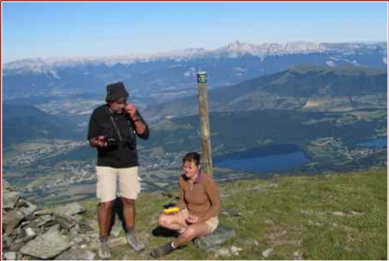
Les lacs du plateau Matheysin et en fond le Vercors