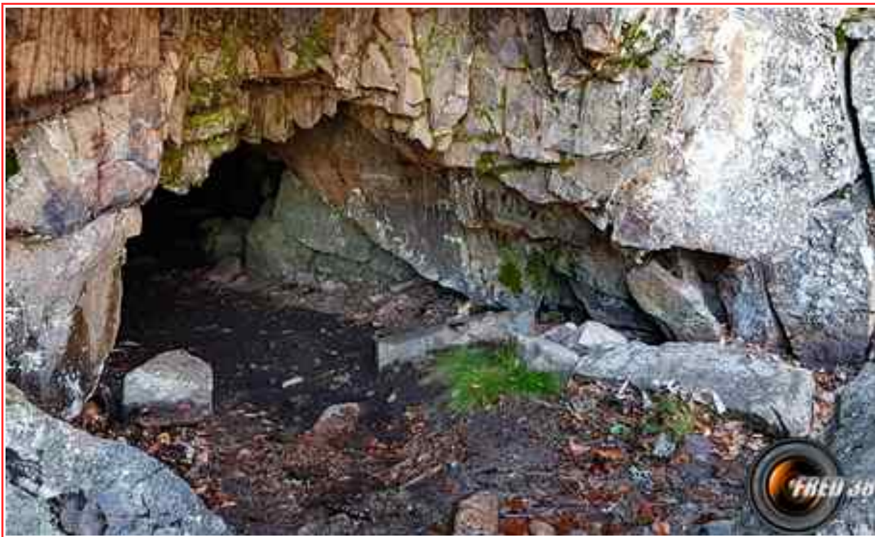
L'entrée de la petite grotte.