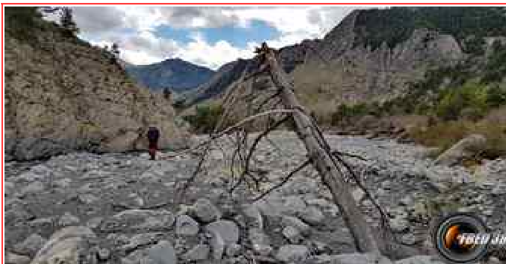
Dand le lit du Galèbre.