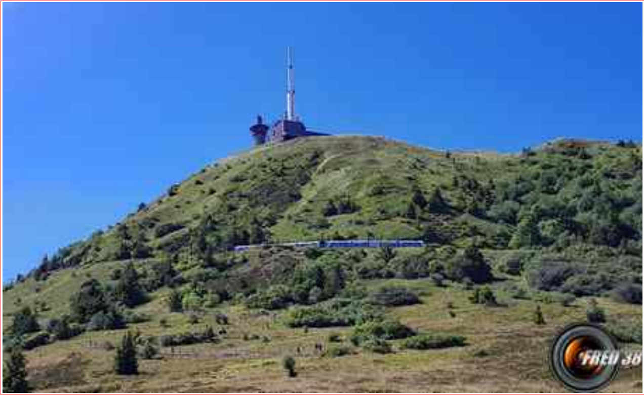
Le Puy et le tramway qui le gravit.