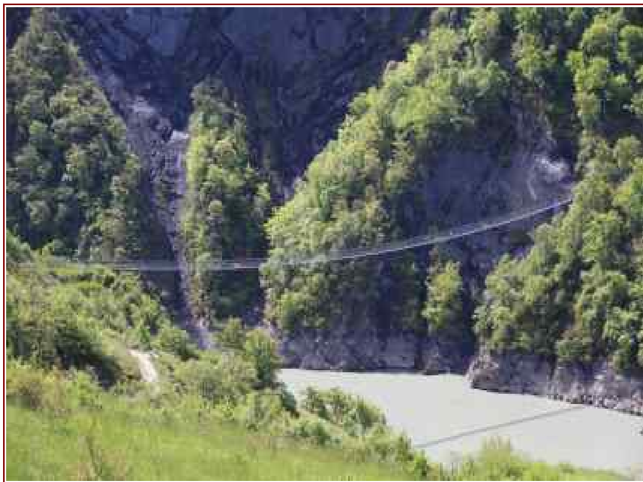
Passerelle du Drac