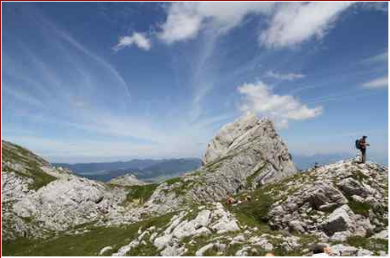
Le Pas de l'Oeille