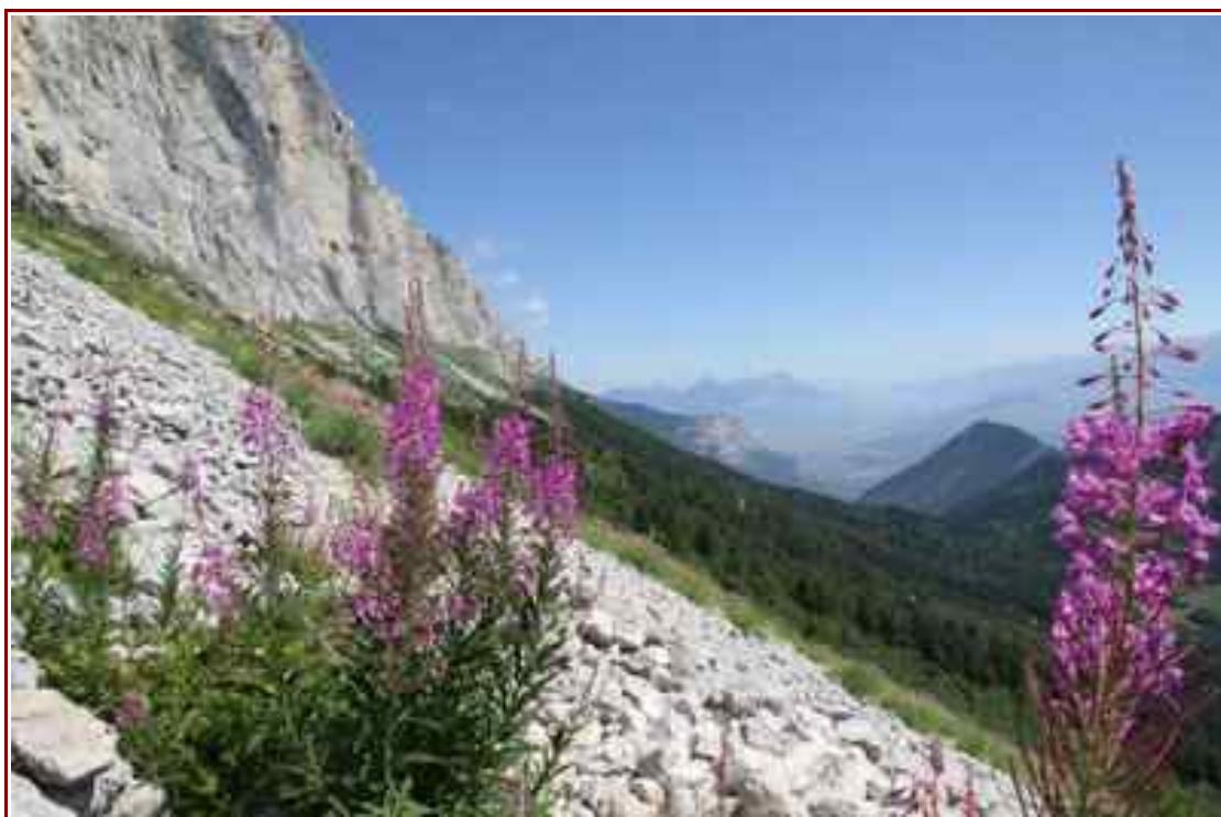
Sentier balcon versant est

Itinéraire pour le Pas de l'oeille 14km, 830 m de dénivelé positif.