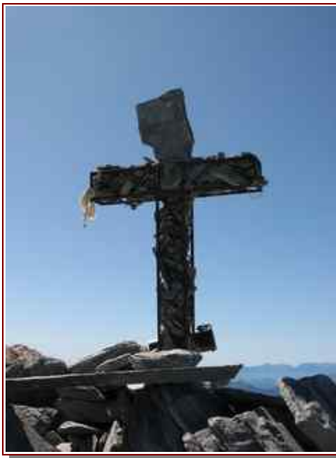
La croix du sommet

Itinéraire pour le sommet 2,5 km, 570 m de dénivelé positif.