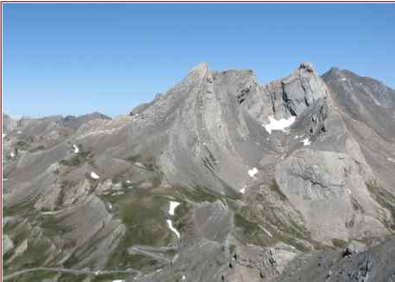
Le Pain de Sucre vu du Pic de Caramantran