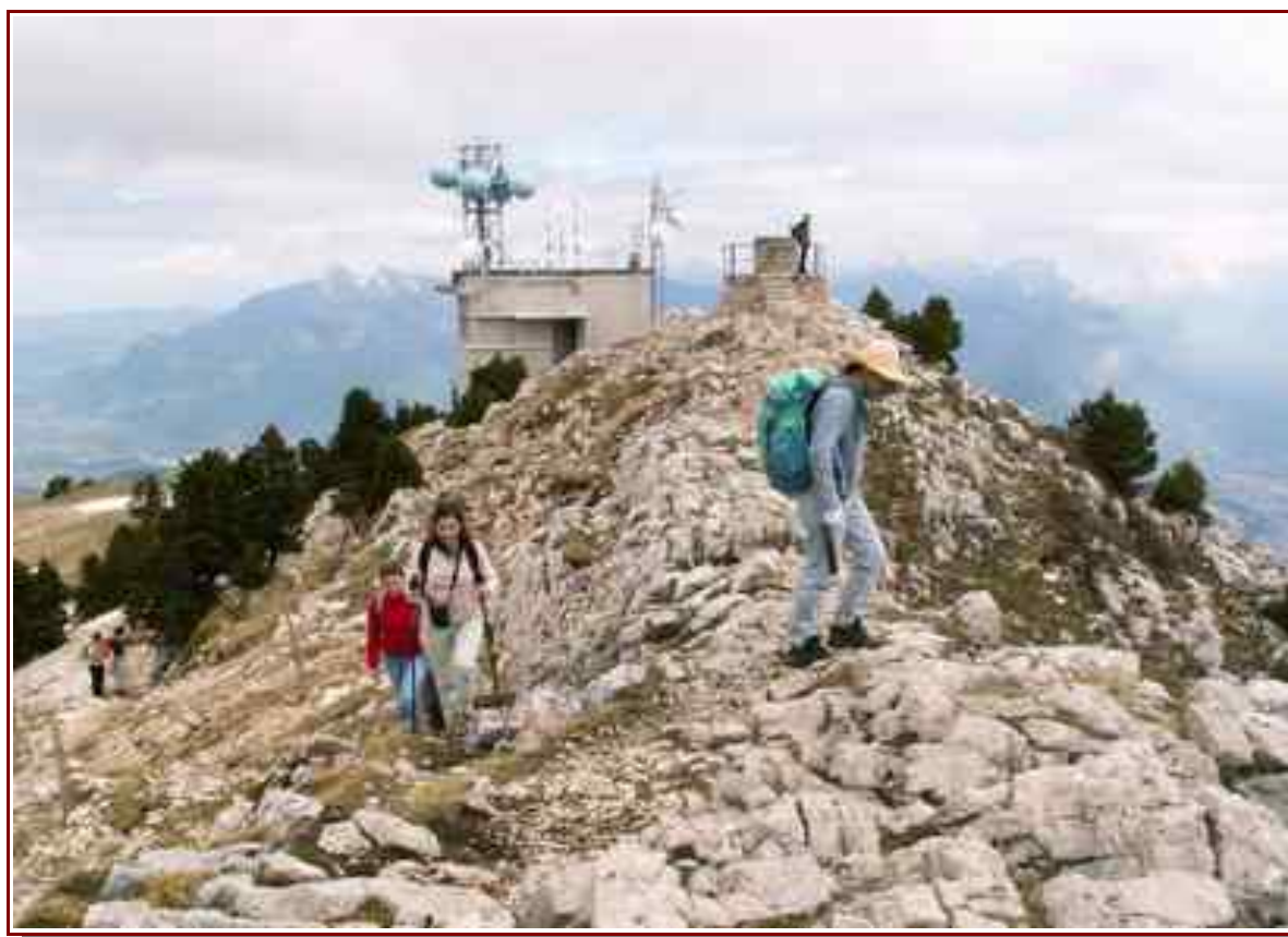
L'arête du sommet et la table d'orientation