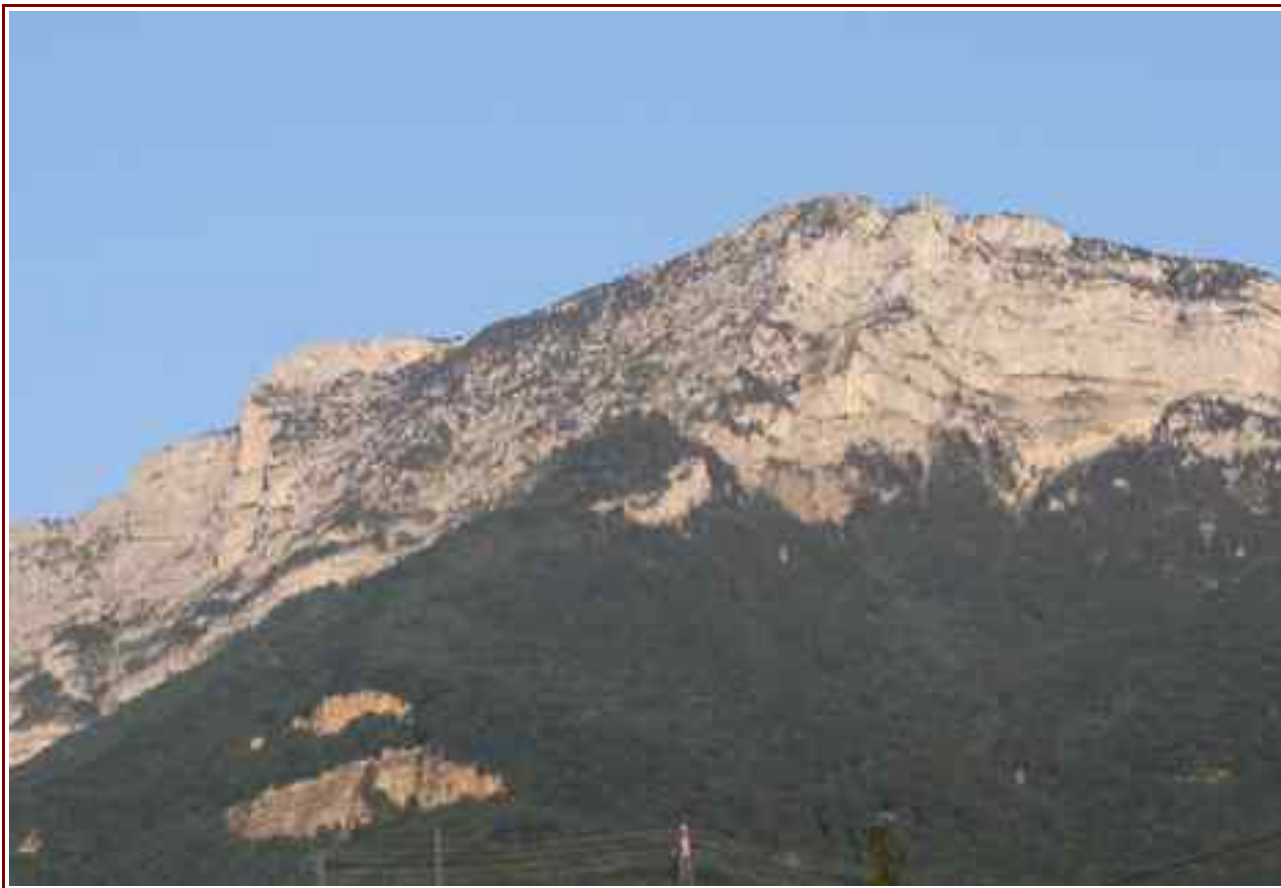
Le sommet vu de Seyssinet