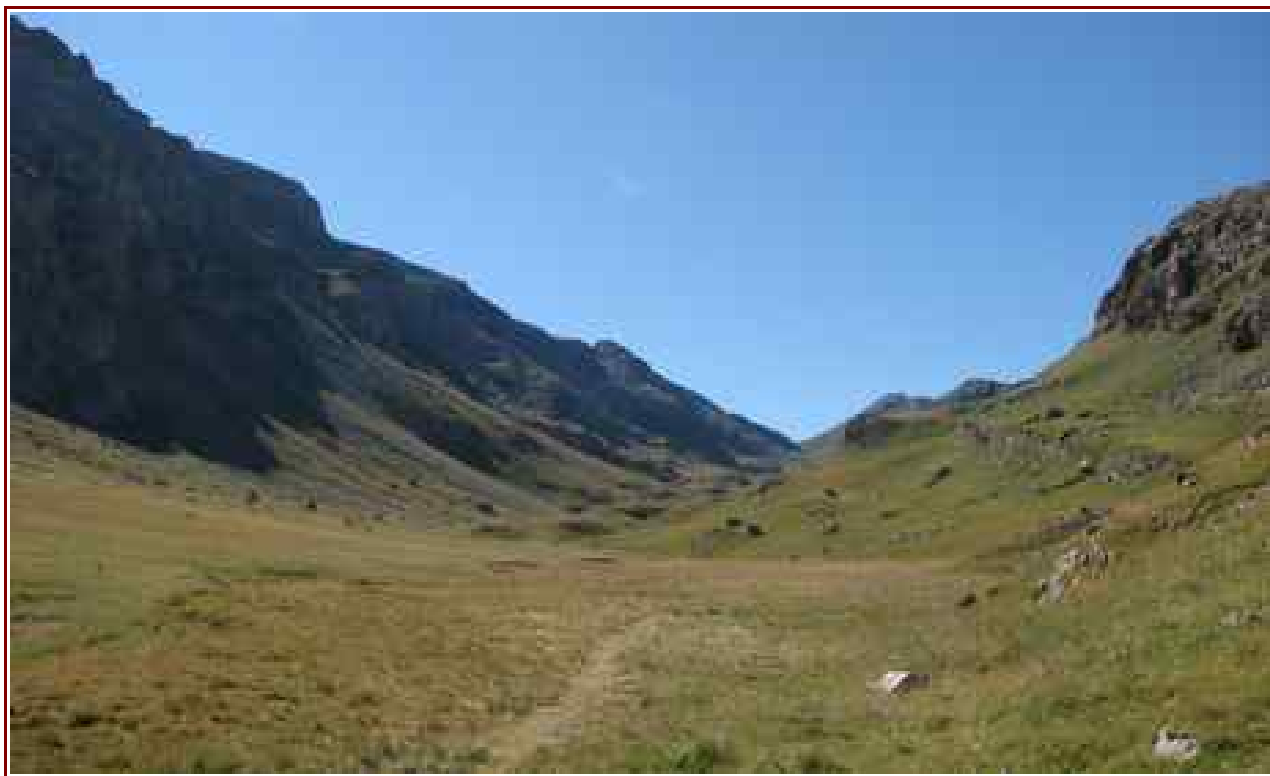
En montant au col de Serenne

— Itinéraire pour le sommet 6,1 km, 890 m de dénivelé positif.