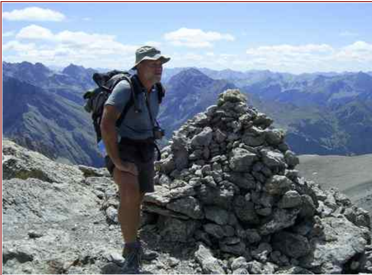
Le sommet .