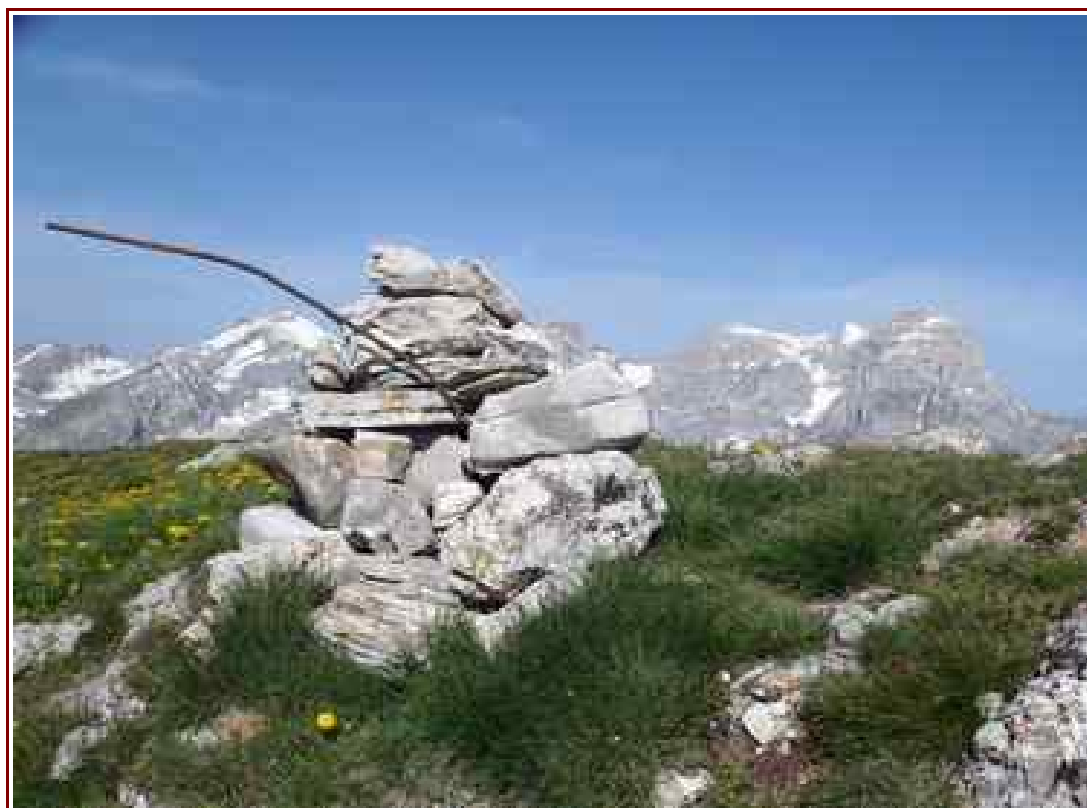
Le sommet et en fond l'Obiou et le sommet de l'Aupet