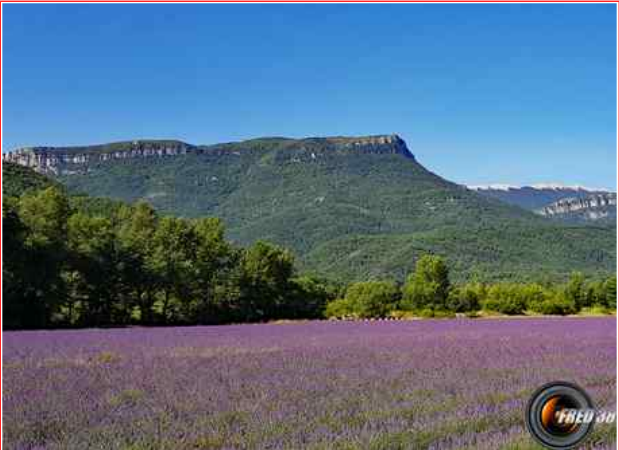
La chapelle et en fond la montagne de Sumiou.