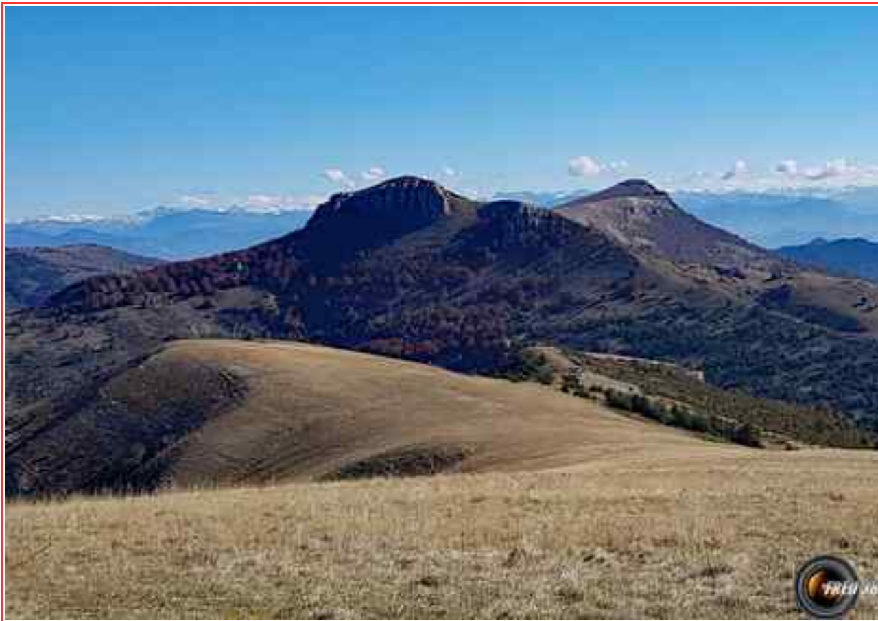
La montagne de Mare vue du "Pied du Mulet".

MASSIF : Diois Baronnies CARTE : IGN 3339 OT