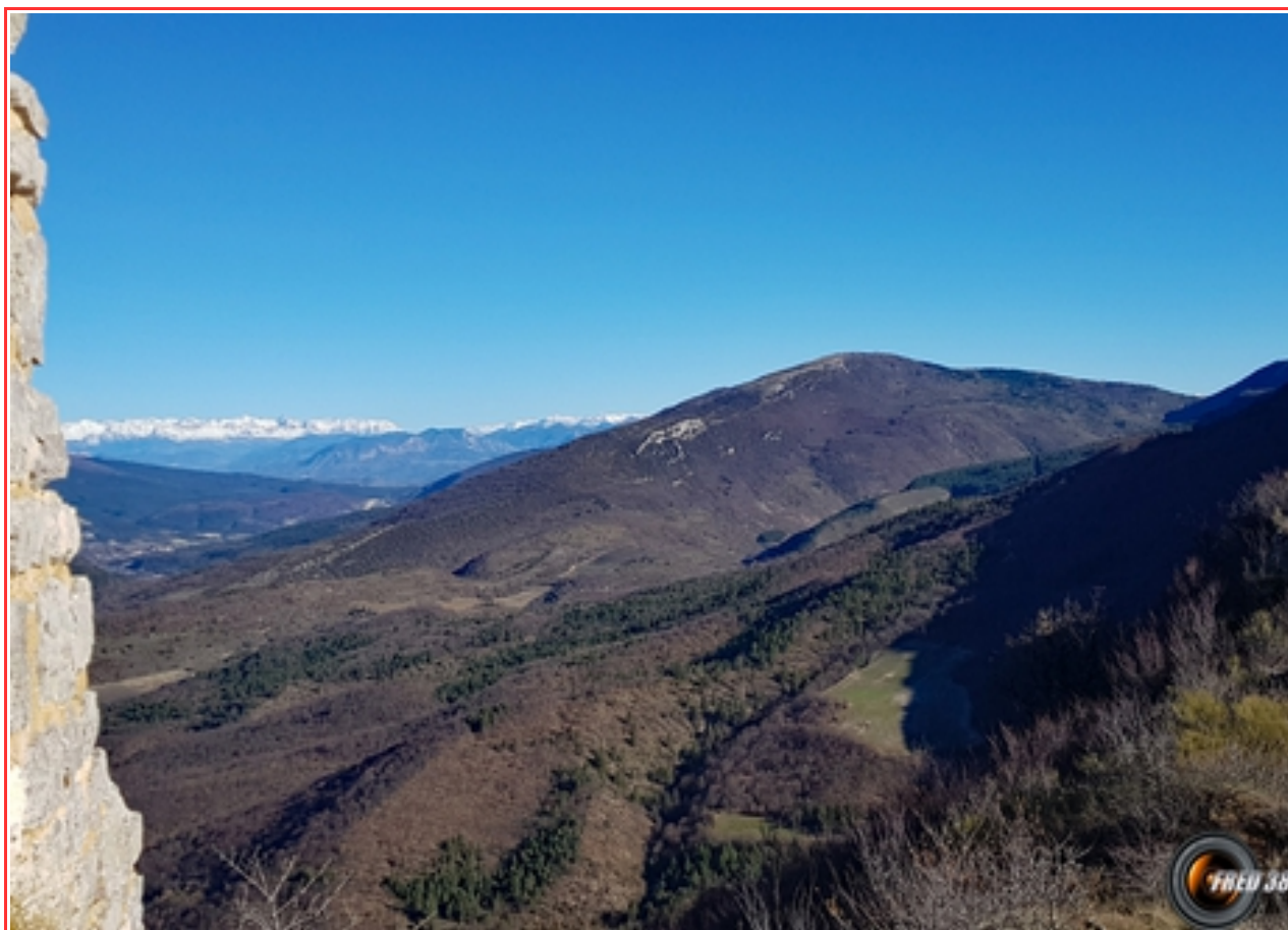
Chanteduc vue de la Tour de Riable.

MASSIF : Diois Baronnies CARTE : IGN 3339 OT