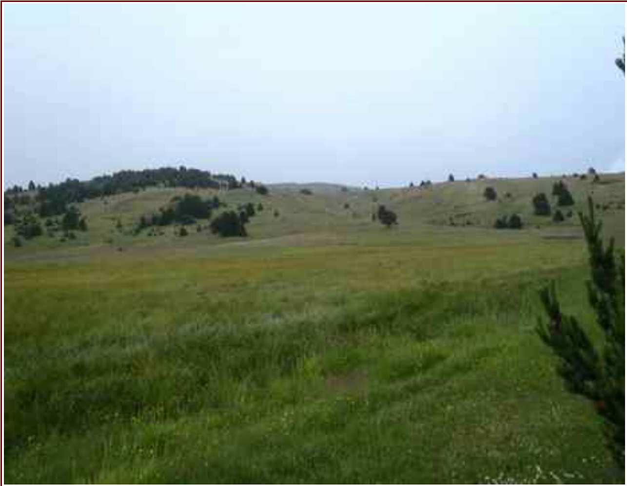
Le sommet vu du marais de Raux