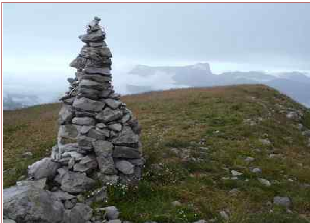
Le cairn du sommet, en fond le pic de Bure