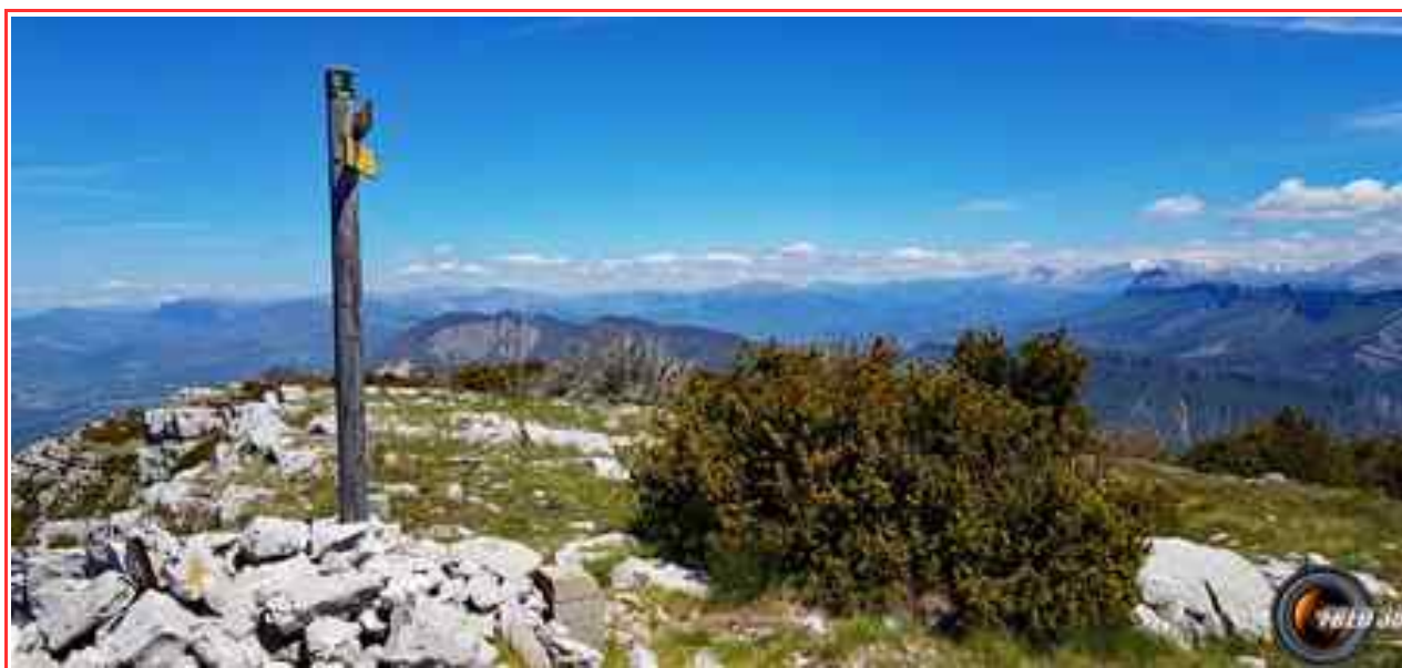
Le sommet et la falaise du Cousson.

— Dénivelé: 830 m ; Longueur 10 km boucle.