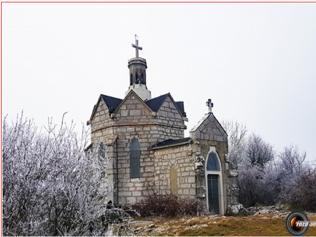
La nouvelle chapelle.