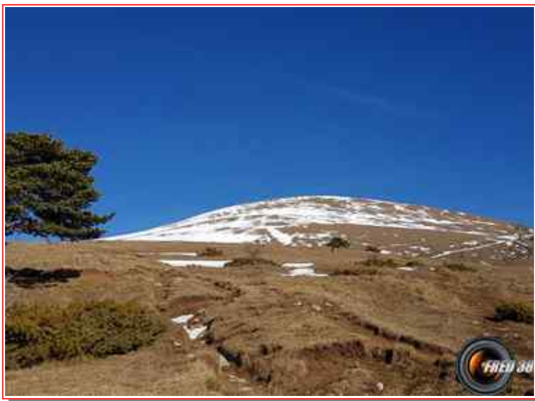
Le sommet vu de la bergerie.