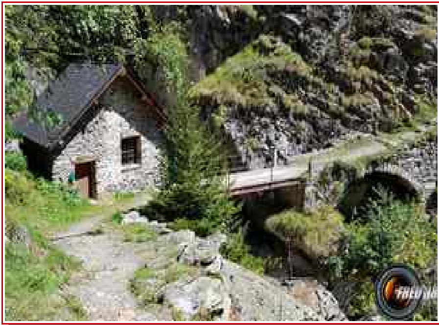
Le moulin du Diable.