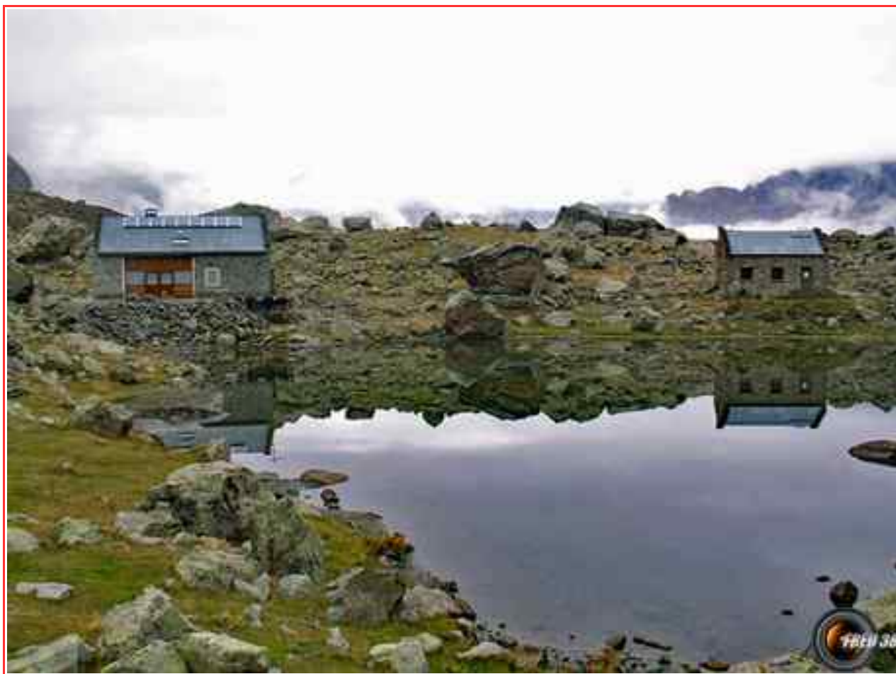
Le lac et le refuge.